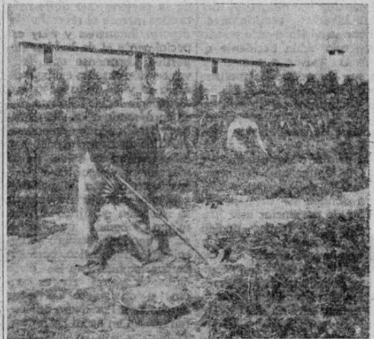
Los "Jardines de la Victoria" en los Estados Unidos

Se han enviado grandes cantidades de sacos de semillas para las Naciones Unidas, pero el último perfeccionamiento de empaque consiste en pequeñas colecciones de paquetes de semillas o estuches de semillas que servirán para la siembra, durante la primavera próxima en ultramar, de hortalizas denominadas "Victoria." Los estuches lle-