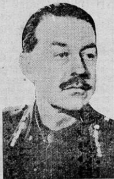
ALEXANDER, the General in Command of the allied operations in Tunes

Moscow reports that a 8,000 ton enemy transport was a few days ago sunk in the Barentes Sea. The Russian Military authorities also report that German casualties on the Soviet fronts since the start of the conflict total nine million, of which four million were killed.