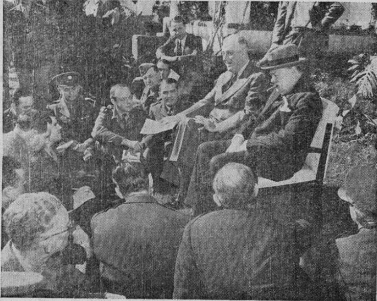
Un aspecto de la histórica conferencia de prensa en que el Presidente Roosevelt y el Primer Ministro Churchill informaron a los periodistas de Gran Bretaña y los Estados Unidos que se había convenido la "rendición incondicional" de las potencias del Eje. Esta fotografía fué tomada en Casablanca.