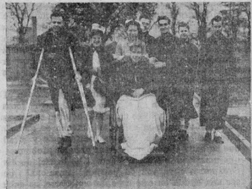
Soldados norteamericanos heridos en el frente tunisino, durante el periodo de convalescencia en un hospital militar de Inglaterra, en donde esperan ansiosos el momento de poder regresar al campo de batalla.